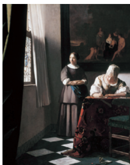
ヨハネス・フェルメール Johannes Vermeer 《手紙を書く女と召使い》"A Lady Writing a Letter with her Maid" 1670年頃 油彩・キャンヴァス アイルランド・ナショナル・ギャラリー・ダブリン

本展では、絵画におけるコミュニケーションというテーマにおいて、画中の人間関係を示唆するような人物描写や小道具の表現に着目します。絵画の中に見出される、文学との関連性、それにまつわる人物や、象徴的な意味合いをおもつ々々を通して、絵画は鑑賞者に語りかけて対話する力を持ち、その謎解きに、私たちを引き込んでいきます。修復後、世界初公開となる『手紙を読む青衣の女』を含むフェルメール3作品と共に、17世紀オランダ美術におけるコミュニケーションのあり方を展観します。