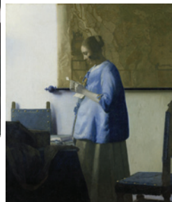
ヨハネス・フェルメール Johannes Vermeer 《手紙を読む青衣の女》"Girl Reading a Letter" 1663-64年頃 油彩・キャンヴァス アムステルダム国立美術館、アムステルダム市寄託

DATA: Bunkamura ザ・ミュージアム 東京都渋谷区道玄坂2-24-1【時間】10時～19時、毎週金・土は21時まで(入館は名開館の30分前まで)【休館日】期間中はなし【入館料】一般1,500円/大学・高校生1,000円/中学・小学生700円【お問合せ】TEL:03-5777-8600(1100-ダイヤル)【アクセス】JR山手線 渋谷駅/子口より徒歩7分/東急東横線・東京メトロ銀座線・京王井の頭線 渋谷駅より徒歩7分/東急田園都市線・東京メトロ半蔵門線・東京メトロ副都心線 渋谷駅3a出口より徒歩5分/京王井の頭線 神泉駅北口より徒歩7分【公式ホームページ】http://vermeer-message.com