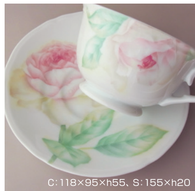
C: 118×95×h55, S: 155×h20

デモンストレーションでご好評を頂いたバラが講座になりました。C/Sに二回焼成で描きます。複雑な花びらの描き方を一緒に学びましょう。