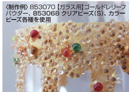
〈制作例〉853070【ガラス用】ゴールドレリーフパウダー、853068 クリアビーズ(S)、カラービーズ各種を使用

ルミナスレリーフパウダーよりつやがあり、なめらかに仕上がるガラス用レリーフパウダーが3色新しく発売されました。薄めに塗り、絵具として使ったり、絵具を濃く使い、レリーフのように盛上げることもできます。また、クリアビーズやカラービーズなどを接着して楽しむこともできるので、クリスマスシーズンやパーティーなどの華やかな場で使う器づくりにもおすすめです。陶磁器用のレリーフパウダーと色味、つや感など揃っているの、陶磁器とガラスをコーディネートして作品を作っても素敵ですね。