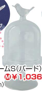
830115 ガラスドームS(バード) ¥1,296 ¥1,036 (高さ16cm)