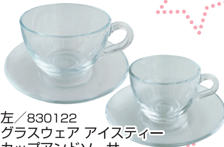
左/830122 グラスウェア アイスティー カップアンドソーサー ¥610 ¥488 (カップ全幅11.5cm、ソーサー直径13.7cm)

◎は陶画舎メンバーズクラブ会員様価格です。通常価格より白磁20%割引・道具10%割引。メンバーズクラブについて詳しくはHP・お電話でお問合せください。