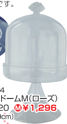
830114 ガラスドームM(ローズ) ¥1,620 ¥1,296 (高さ19cm)