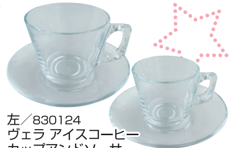
左/830124 ヴェラ アイスコーヒー カップアンドソーサー ¥610 ¥488 (カップ全幅10.9cm、ソーサー直径13.7cm)