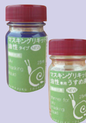
左/852575 油性マスキングリキッド NEW ¥1,080 ¥972 リニューアルして、商品が新しくなりました。従来のものより乾燥が遅くなったため使いやすくなっています。